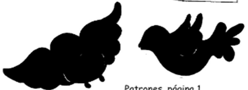
Patrones, página 1