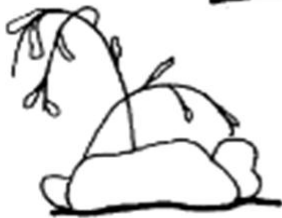
Patrones, página 2

Resultado: Te debe quedar como este ejemplo, la próxima clase veremos lo que sigue de la manualidad