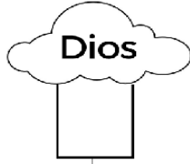
Ejemplo Lana abajo

Instrucciones: necesitamos un vaso pintado de color azul (será el cielo), lana y los moldes impresos cortados. Luego pegarás la nube en el vaso, en la lana pegarás a los niños orando y "la oración me acerca a Dios" debes hacer un agujero en el vaso y pasar el hilo. Te debe quedar como los ejemplos: