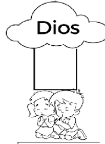
La oración me acerca a Dios